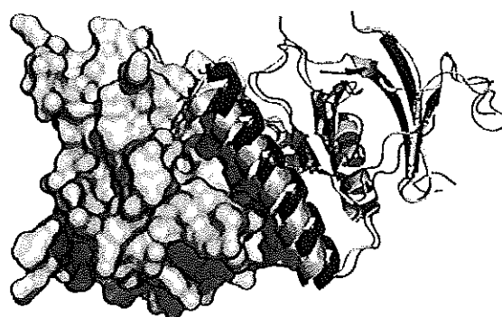
図 2 SKE-DOCK server が予測したドッキング構造と実験構造(Arf1/ARHGap10, PDB entry 2j59)との比較 予測構造：黒 実験構造：白

第1の要素、サンプリング方法に求められるのは、複合体の結合状態を密に精度よく探索することである。このサンプリング方法の網羅性が不十分であるならば、そもそも真実のタンパク質複合体の構造に近い候補を得ることは不可能となる。